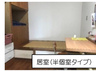
居室(半個室タイプ)

男女各棟に半個室タイプの居室を整備し、プライベートな空間を保つなど舎生の実態に応じた環境を整えています。